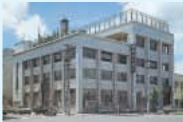
(本店社屋/昭和29年～44年)

行是「信を万事の本と為す」に立脚し、公正明朗かつ堅実な業務運営により設立の使命である国民貯蓄の増強と中小企業金融の円滑化に寄与することを経営理念に掲げ、昭和26年7月5日創業いたしました。