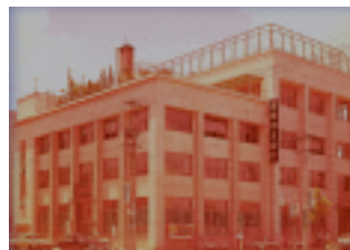
本店社屋（昭和29年～44年）

行是「信を万事の本と為す」に立脚し、公正明朗かつ堅実な業務運営により設立の使命である国民貯蓄の増強と中小企業金融の円滑化に寄与することを経営理念に掲げ、昭和26年7月5日創業いたしました。