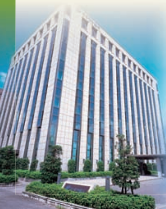
きらやか銀行本店(山形市)