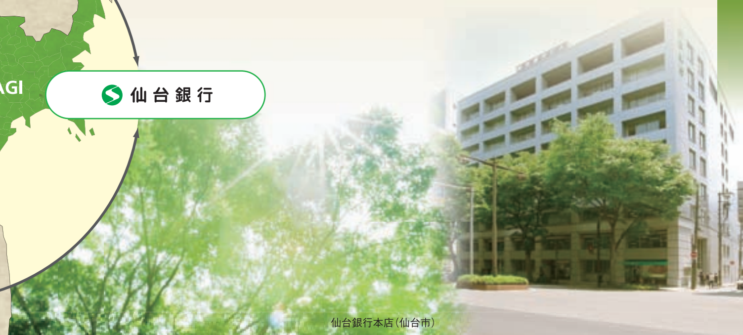
仙台銀行本店(仙台市)