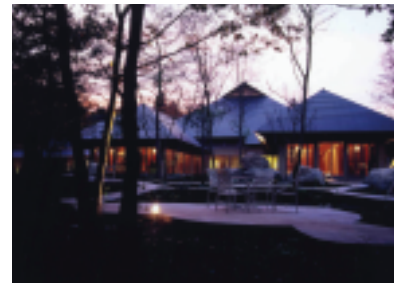
遠刈田温泉「温泉山荘・だいごんの花」

「夏の感謝祭」を平成17年6月～7月に実施し、抽選で15組30名さまに遠刈田温泉「温泉山荘・だいごんの花」さまの1泊2日ペア宿泊をプレゼントいたしました。