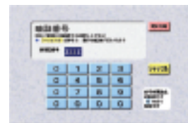
ATMの暗証番号配列のシャッフル表示例