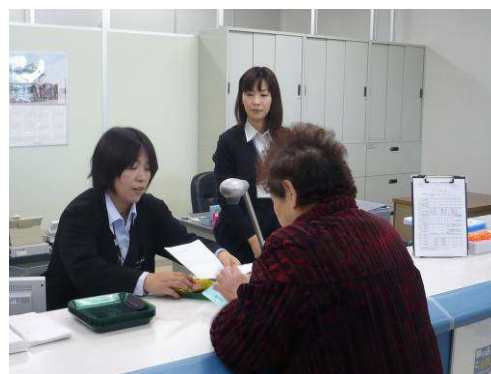
当行女川仮設合同庁舎出張所の窓口