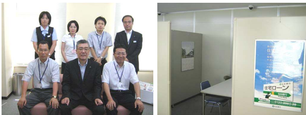
石巻住宅ローンプラザの開設（平成23年7月）

当行は、今後平成24年夏頃を目途に、住宅の新規・再取得ニーズや震災リフォーム等の需要が見込まれる仙台市泉区（将監支店内）にも、住宅ローンプラザを増設してまいります。