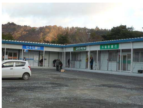
女川仮設合同庁舎の金融機関店舗

また、同じく平成24年夏頃を目途に、津波被災地のお客さまの利便性を確保するため、巡回型の移動式店舗を導入して窓口営業を行う方針です。