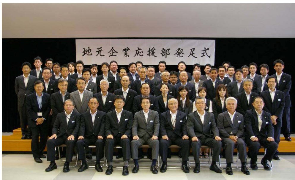
地元企業応援部の発足式（平成23年7月）

平成24年4月を目途に、当部は最終的に60名体制とする計画であり、店舗移転・統合等を通じて営業担当職員を順次再配置し、復興支援・推進体制を強化してまいります。