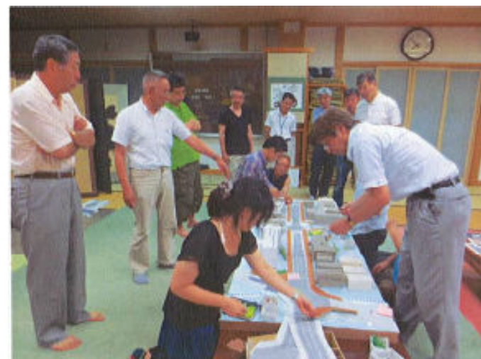
石巻市の震災後の街並みについて 模型を用いて協議しました