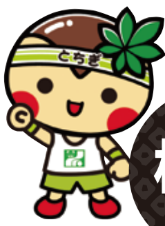
栃木県マスコットキャラクター とちまるくん

ご当地B級グルメ「石巻焼きそば」を広めるため、震災後にキッチンカーでの営業をスタート。二度蒸ししてできる茶色い麺が特徴で、魚介系出汁の蒸し焼きにより旨味が凝縮されています。後がけソースでどうぞ。 喜栄(石巻)