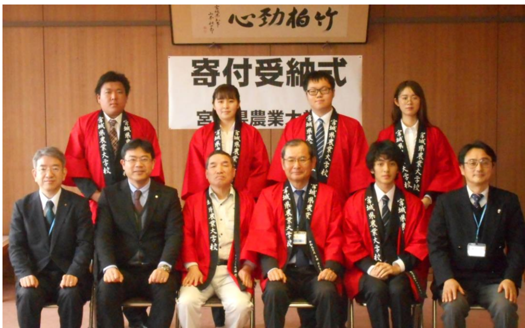
(贈呈式の様子 写真上段：生徒会の皆さま