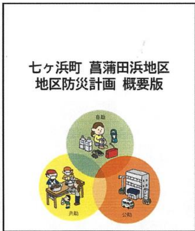
本リーフレットは、令和5年度仙台銀行まちづくり基金の助成を受けて作成されました。

津波浸水想定を踏まえた地域防災を推進するため、地区防災計画・リーフレットを作成し、地区防災ワークショップを実施しました。