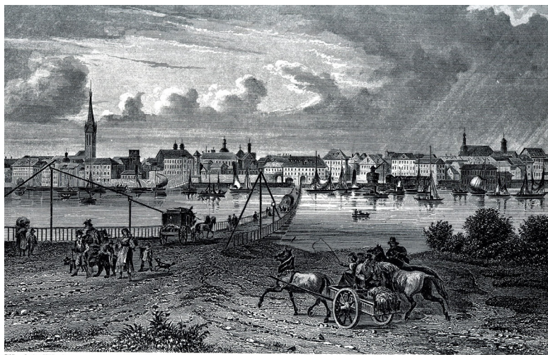
DÜSSELDORF UM 1850