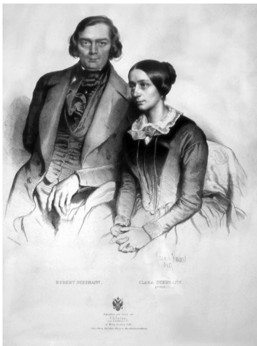
ドレスデン時代のシューマン夫妻(1847年)

シューマンの創作は時期によってその傾向を異にする。1830年代はほぼ全作品がピアノ作品の創作で占められ、1840年は歌曲、1841年は管弦楽、1842年は室内楽が集中的に作曲された。健康を害した後の1845年からライン川に投身自殺未遂を起こす1854年までの創作もまた大きく異なる。それぞれの時期において創作傾向