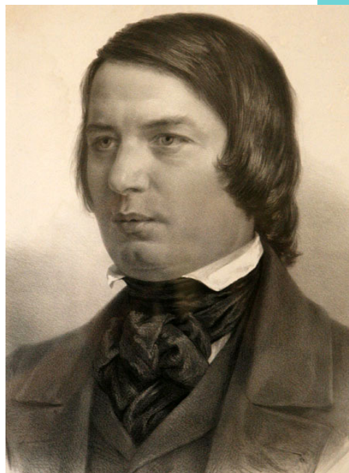
シューマン(画:アドルフ・フォン・メンツェル)