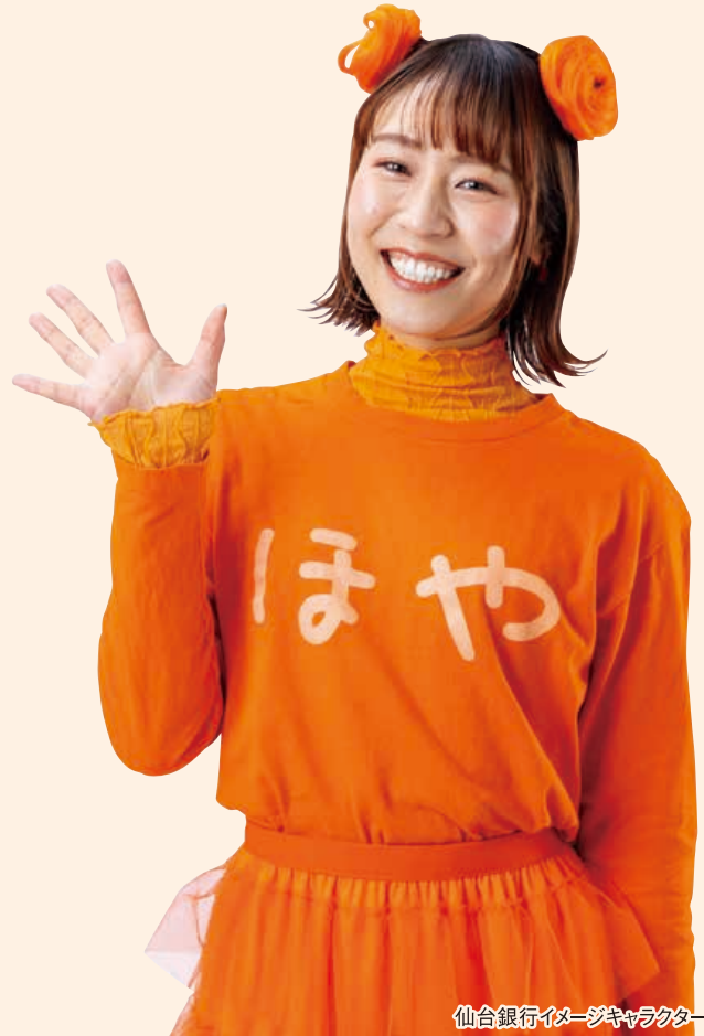
仙台銀行イメージキャラクター 萌江

年金を受取るには複雑な年金請求手続きが必要です。仙台銀行では、委託契約する社会保険労務士が面倒な年金受取り手続きを無料代行いたします。年金のお知らせが届きましたら、仙台銀行にご相談ください。